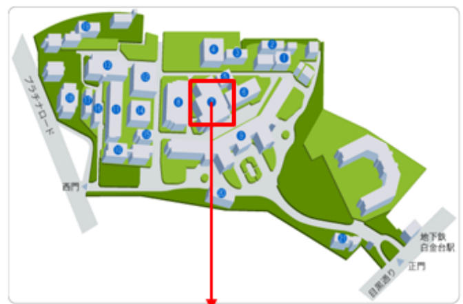
<キャンパスマップ>